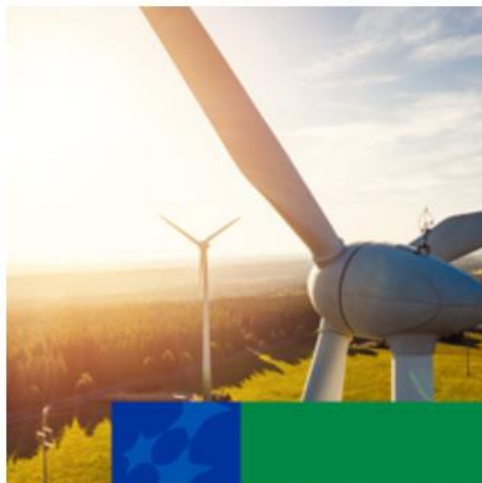
Infrastruktura, Klimat, Środowisko