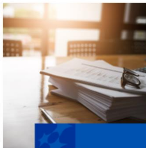
Prawo i dokumenty